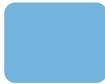
535 Azul Danubio