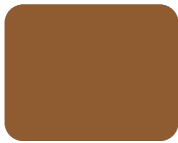
543 Gamuza R