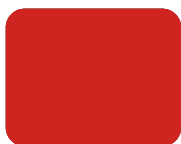
564 Rojo fuego