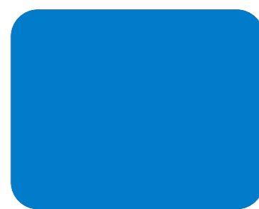
539 Azul luminoso R