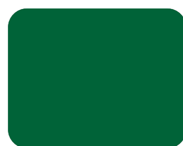
514 Verde hierba R