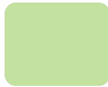
538 Verde pastel