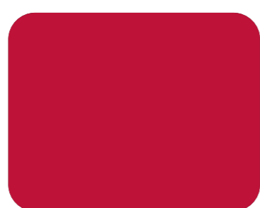
563 Bermellón R