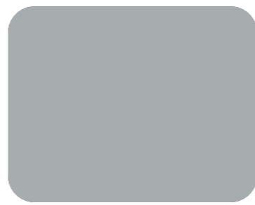
509 Gris perla R