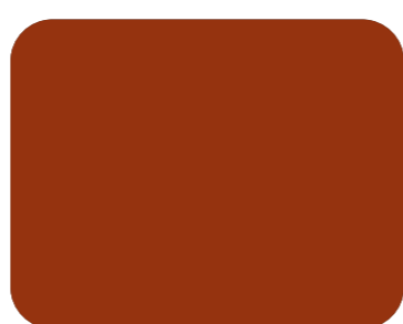
555 Rojo inglés R