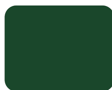
559 Verde mayo R