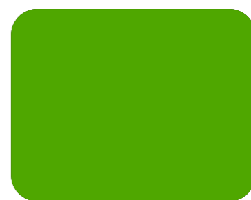
519 Verde manzana