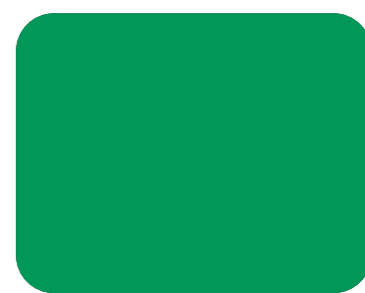
516 Verde primavera R