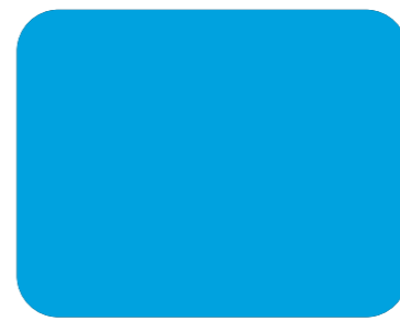
536 Azul ancla